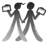
協会シンボルマーク