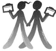
協会シンボルマーク